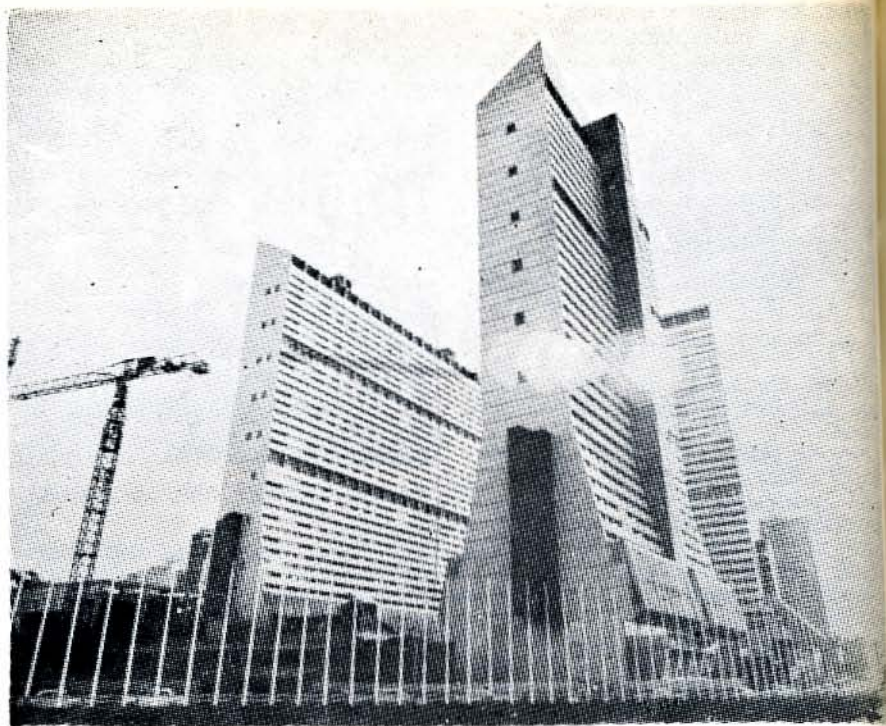
Los cuatro edificios del Parque Central, ya terminados, donde se ha celebrado la Conferencia del Mar, en Santiago de León de Caracas

La perspectiva idónea sobre los otros recursos —que son por naturaleza móviles, con frecuencia migratorios, y siempre reconstruibles en virtud de auto-reproducción y cría espontánea—, es muy distinta. Primero por su desvinculación originaria respecto al macizo ribereño. Después, porque este país siempre goza